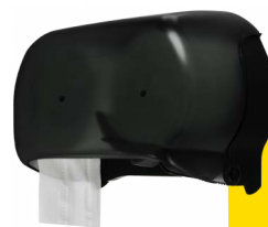
Modern Black E402102